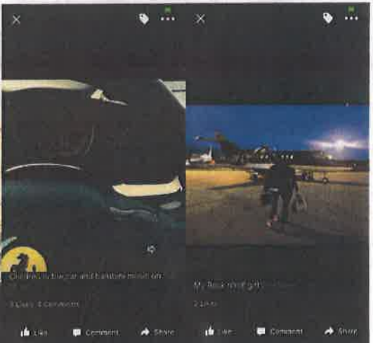
SKUPOCJENI AUTOMOBILI, JAHTE I PRIVATNI AVIONI BITAN SU DIO ŽIVOTNOG STILA DE VILERÉ KOJIM SE HVALI I NA FACEBOOKU